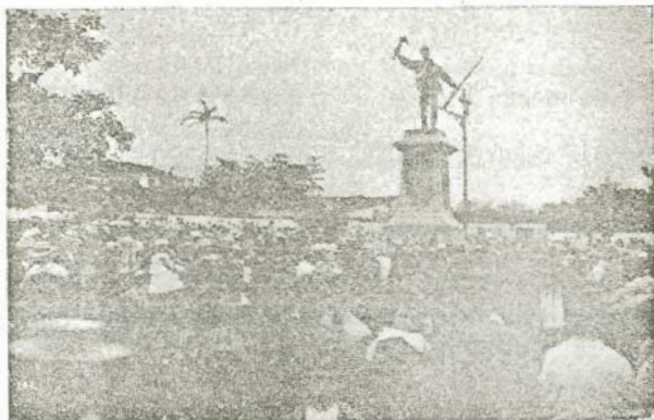
Estatua de Juan Santamaría

¡Juan Santamaría!... He oído discutir su acción... que no es de Alajuela, sino de Barba... que era feo, con el pelo erizado; que era un hombre